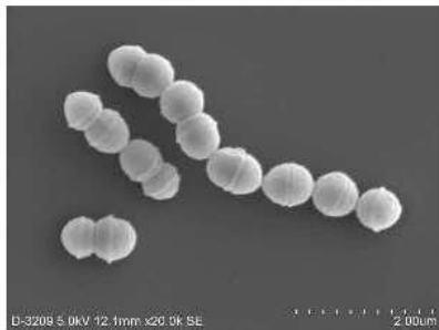
Gekisyougata-youketusei-rensakyuukin-kansensyuu motoho ne 'A-gun-youketusei-rensakyuukin' (Kokuritu-kansensyuu-kenkyuuzyoo noka)