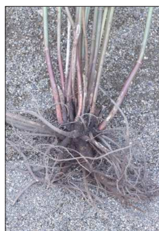
<カラフトニンジン>

正樹 ニシパ エネ ハウエアニ; 「シラウオイ (白老) マチヤ オルン 野本 Masaki nispa ene hawean hi; “Siraw-o-i ( Siraoi ) maciya or un Nomoto